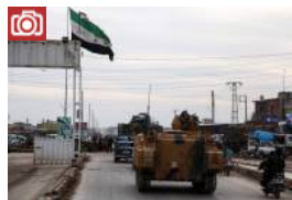
Opération rameau d'olivier : les risques d'un embrasement