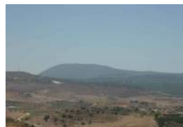
La loi d'amnistie toucherait les Libanais en Israël