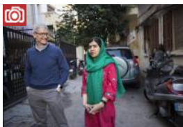
Tim Cook et Malala à Beyrouth, une Tabshoura à la main...